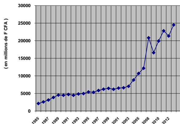
Evolution du chiffre d'affaire vie de 80 à 2012